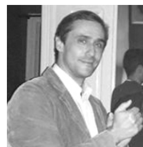
Por: Luís Mouga Lopes

Antes de mais, deixo o seguinte registo: historicamente, prova-se que a inflação prejudica sobretudo os mais pobres através da evolução da distribuição do rendimento nacional entre trabalho e capital, nomeadamente em períodos de inflação elevada e duradoura como a atual. Já a taxa de juro, que é apenas uma das componentes da inflação, não afeta toda a gente... apenas a que tem dívida! Ou seja: a maldita inflação afeta toda a gente de forma brutal, sendo os mais pobres os mais afetados, notando-se que a bazuca inflação é mais cega do que a carabina taxa de juro! Fiquemos por aqui, no que diz respeito a armas de destruição, pois neste artigo quero lembrar um dos projetos-lei do PCP, que propunha promover políticas de justiça fiscal: o Projeto-lei nº 839/XV/1, apresentado no Parlamento no passado mês de julho. Contra este projeto, votaram os deputados do PS (120), do irmão gémeo mal amado PSD (77) e, claro, dos filhos e enteados IL (8) e CH (12). Deputados estes que representam o mesmo de sempre, o